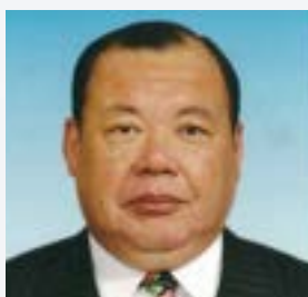
LCIF エリアリーダー（西日本）