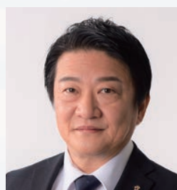
常務理事 / YCE 副委員長