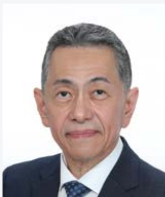
地区ガバナー 栗栖 正明