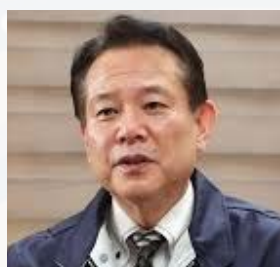
専務理事 / PR マーケティング委員長 国際理事候補者資格審査委員